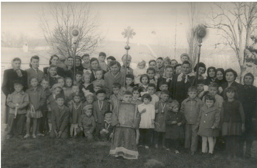
Fotografija sa Vrbice, na obeležavanju Lazareve subote sa istim sveštenikom .