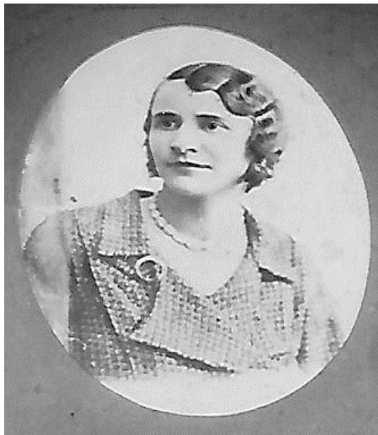
Bisenija Nilolić (1908)